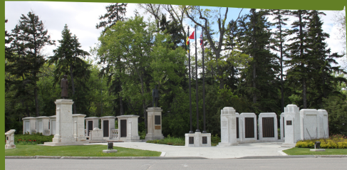
MONUMENT COMMÉMORATIF DE GUERRE

Ce pont mesure 256 mètres, et était un projet économique pendant la Dépression. Premier ministre J.T. Anderson l'a dédié en 1930 comme monument commémoratif aux soldats qui ont perdu la vie pendant la Première Guerre mondiale. On dit que c'est le pont le plus long sur le plan d'eau le plus petit.