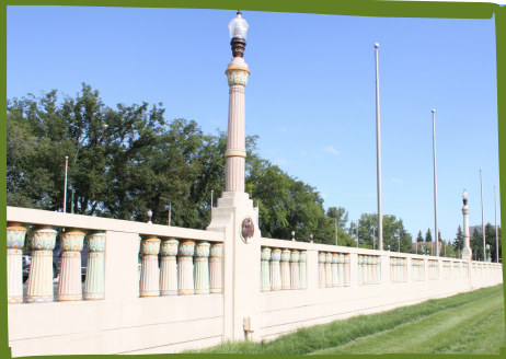
LE PONT MEMORIAL

Ce pont mesure 256 mètres, et était un projet économique pendant la Dépression. Premier ministre J.T. Anderson l'a dédié en 1930 comme monument commémoratif aux soldats qui ont perdu la vie pendant la Première Guerre mondiale. On dit que c'est le pont le plus long sur le plan d'eau le plus petit.