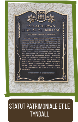
STATUT PATRIMONIALE ET LE TYNDALL

L'édifice a reçu le statut patrimonial nationale en 2005. La plaque se trouve sur le devant du bâtiment de l'édifice. Regardez au la calcaire dolomitique de Tyndall du Manitoba. Les fossiles sont dispersés partout dans la pierre!