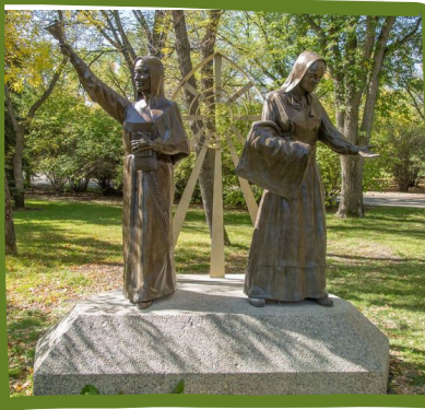
PATRIMOINE DES SŒURS

Celle-ci est une réplique de la statue au Musée national du mémorial aux victimes du Holodomor à Kiev, Ukraine. Elle est consacrée à des millions de personnes qui sont mortes dans la famine ukrainienne de 1932 à 1933. Environ 1 personne sur 5 en Saskatchewan sont de l'origine ukrainienne, et beaucoup de familles dans la province ont été affecté par la famine.