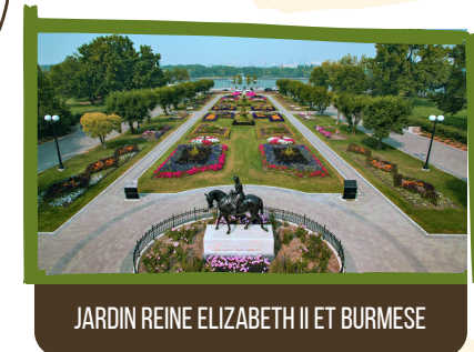
JARDIN REINE ELIZABETH II ET BURMESE

L'édifice a reçu le statut patrimonial nationale en 2005. La plaque se trouve sur le devant du bâtiment de l'édifice. Regardez au la calcaire dolomitique de Tyndall du Manitoba. Les fossiles sont dispersés partout dans la pierre!