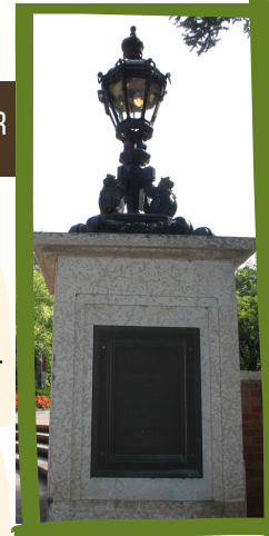
LE SPEAKER'S CORNER

Ce monument port les noms de tous les citoyen(ne)s de la province qui ont donné leur vie au service du pays. Il y a plus de 2,200 noms de ceux qui ont combattu dans les deux guerres mondiales, la guerre de Corée, et les opérations de formation. Les noms sont ajoutés au besoin