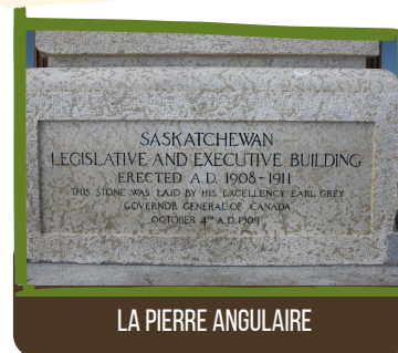
LA PIERRE ANGULAIRE

Cette fontaine a été donnée au Canada par Le Fonds National de Collection d'art de la Grande-Bretagne. Elle est un des deux données au pays, et se situait à Trafalgar Square à Londres de 1835 à 1939. L'autre se trouve à Ottawa.