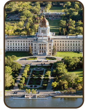
STYLE DE BEAUX-ARTS

L'édifice est agrémenté de caractéristiques édouardiennes, un style d'architecture britannique, pour montrer les liens du Canada avec la Grande-Bretagne.