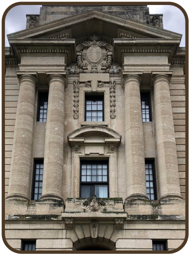
L'ENTRÉE À CÔTÉ DE L'AILE

Au-dessus des entrées latérales en façade il y a des colonnes jumelées qui soutiennent un fronton. Ce fronton est différent de celui de l'entrée principale car il est ouvert en bas, ce qui est en fait un fronton brisé. À l'ouverture, on peut voir des fruits, des céréales et une couronne - des symboles importants pour la Saskatchewan et le Canada.