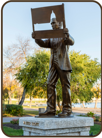
HON. WALTER SCOTT

Education & Patrimoine Parlementaire Legislative Assembly of Saskatchewan