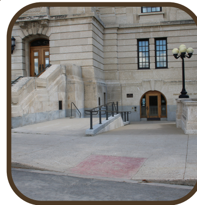
L'ENTRÉE DU PRINCE-DE-GALLES

Conçue pour se fondre dans le reste de l'édifice, l'entrée Prince-de-Galles a été inaugurée en 2001. Grâce à cette entrée sans obstacles, le palais législatif de la Saskatchewan est devenu le premier édifice législatif au Canada à recevoir la certification de la Fondation Rick Hansen pour l'accessibilité en 2021.